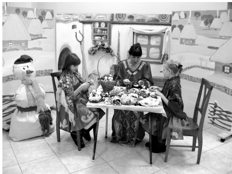
В фойе РДК перед отчетом.

В администрации утвержден спичечный состав муниципального резерва управленческих кадров, в который включены 15 человек. Работа с кадровым резервом проводится с целью повышения уровня профессиональной подготовки муниципальных служащих.